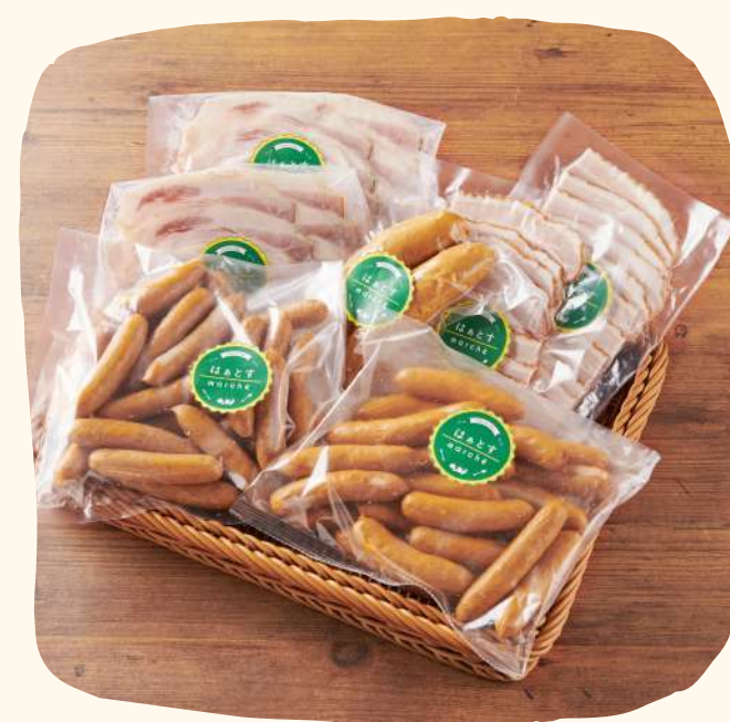
無添加ベーコン ・ソーセージ