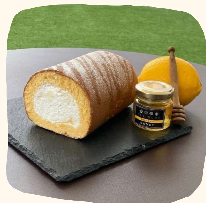
神戸御影 TOKINONE 日本みつばちのはちみつ レモンロール