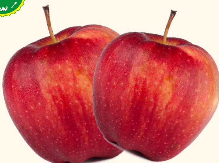
青森県さくらば農園直送 りんご (・葉とらずりんご ・星の金貨)