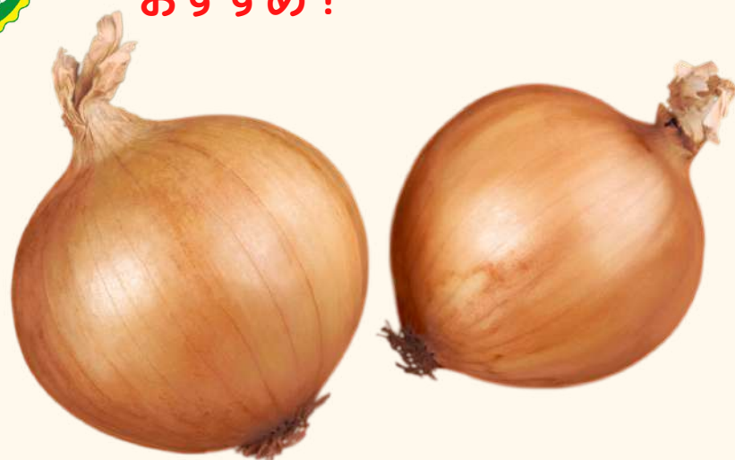
淡路産産玉ねぎ (藤玉)