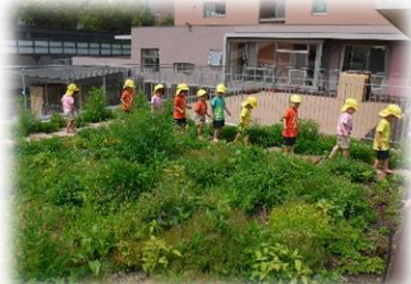
屋上野草空間「空庭」

園舎は保育室・職員室や会議室からなる棟と、一階部分が絵本コーナー兼カフェスペース、二階部分が大ホールの棟がつながったコの字型のレイアウトです。保育室と保育室の間にはコーナー遊びが展開しやすいようにスペースが設けられています。また、保育室同士が回廊で繋がり、遊びの様子が異年齢の間で視覚的に共有しやすいようになっており、さらに家具による間仕切りで保育室のレイアウトが自在にとれるように構成されています。また、園庭にも各所に遊びが広がる工夫を散りばめています。