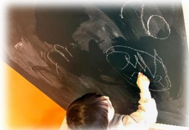
自由に壁に絵がかける部屋