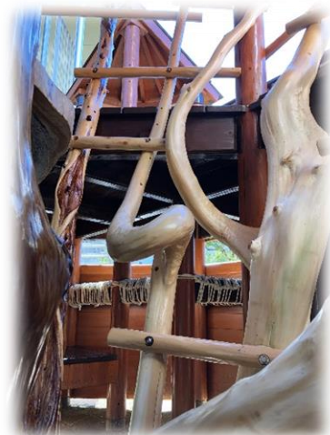
体幹を鍛える 大型遊具